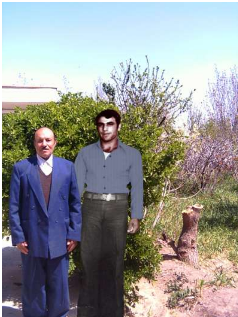
این عکس در فروردین ۱۳۸۴ از پدر شهید و در منزل ایشان گرفته شده و عکس شهید به آن اضافه شده است.